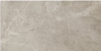
REGENSTONE SILVER P6012L